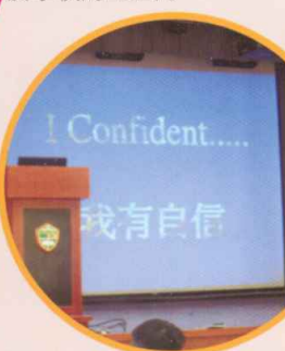
4月30日中一成長營檢討