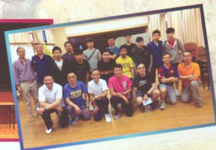
校友學長與學生合照