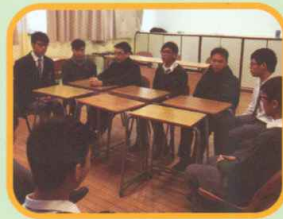
中六級模擬面試工作坊