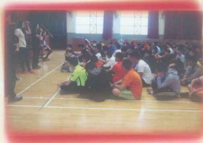
學生參與營前訓練

● 中一「I CAN」成長營前訓練： 營前訓練目的是建立學生的團隊精神、自信心、責任感及不輕易放棄的精神，從而將這些精神應用在學習和日常生活中。