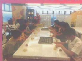
同學親自製作鳳梨酥