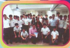
學生參觀珠寶行業