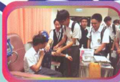
學生參觀護理教學中心

為了讓學生了解飲食業的運作模式及提供有關就業前景的資訊，升學及擇業輔導組安排了本校學生出席由香港輔導教師協會舉辦的行業體驗活動。本校學生於2015年3月19日中午到尖沙咀一間德國餐廳King Ludwig Beerhall學習餐桌禮儀，並從中了解飲食業的運作。除以上活動外，升學及擇業輔導組亦安排學生出席多個行業體驗活動，例如參觀中央郵件中心、入境處、酒店、物流公司、珠寶公司、護理行業機構及香港警察學院等，讓同學加深對各行各業的的認識。