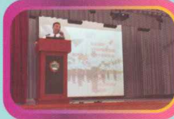
入境處到校進行講座