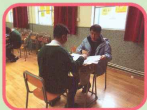
老師為同學進行模擬面試

升學及擇業輔導組及學友社於2014年12月18日為中六學生舉辦「模擬放榜工作坊」。活動目的是讓中六學生嘗試經歷放榜過程，舒緩放榜當日因要選擇出路而產生的焦慮，並提醒他們及早策劃未來。中六同學皆表示活動令他們對香港中學文憑試的放榜及中六學生出路有更深入的認識，使他們更有信心面對未來。