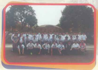
華南理工大學師生合照

在華南理工大學，我們出席課程介紹講座，講者講述學校的背景及有關升讀內地大學的各種條件，原來香港學生在內地升學比國內學生更為容易，香港學生只要達到一定資格便可以入學。而且到國內大學升學，能讓自己有多一條出路選擇。總括而言，是次交流活動讓我獲益良多，令我對國內大學有更多的認識，我覺得實在不枉此行。