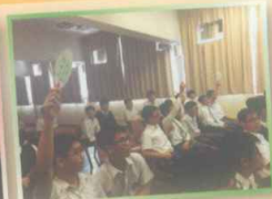
各參賽班別踴躍搶答