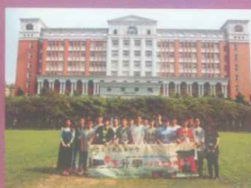
國立台北大學前合照