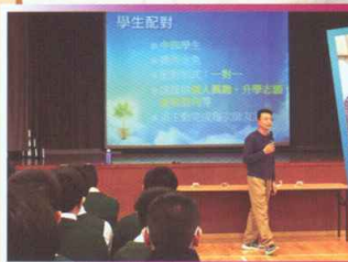
學長正為大家講解計劃詳情

本校升學及擇業輔導組與校友會於2015年3月開展「校友學長計劃」。是項計劃邀請校友擔任學長，以亦師亦友的身份，與學生分享升學、工作及人生經驗。學生透過聚會及交流活動，認識校友學長的專業和人生經驗，從而得到寶貴的意見，增強自信心及擴闊視野。同時，校友學長透過關懷和指導，提升學生的待人處事態度和與人溝通技巧，幫助同學個人的心智成長。