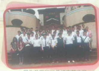
學生參觀和記黃埔中藥公司