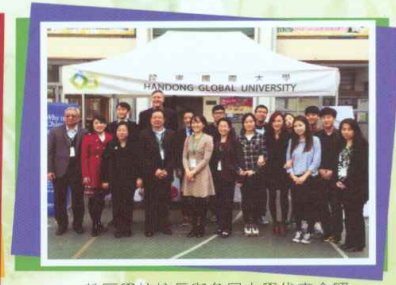
教區學校校長與參展大學代表合照