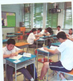
學生積極準備應付考試