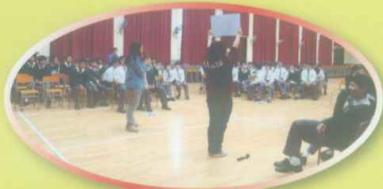
本校邀請教區青年牧民委員會到校舉行工作坊

本校早前舉行了一年一度的「宗教周」，主題為「聖神Fun Fun Fun」，教導學生因聖神生活，隨從聖神的引導而行事，在聖神內，光榮天父。活動包括早會分享、聖經常識問答比賽、書展、攤位遊戲、福傳魔術等。本校更邀請了教區青年牧民委員會到校為中一至中三級學生舉行工作坊，主題分別為「我是主的羊」、「進入羊棧」及「快樂人生」，以遊戲形式讓學生認識天主對人的召叫及加深學生對教會的認識。