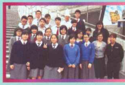
與校友同學一同參觀飲食行業