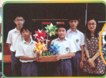
為中一同學定立的目標祈禱