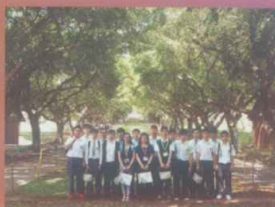
東海大學林蔭大道上合照