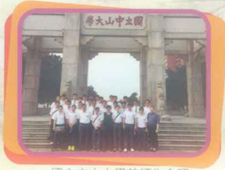
國立中山大學前師生合照