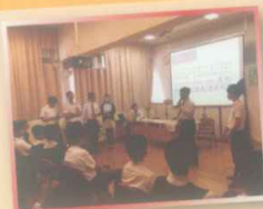
高中學生模擬各種消費陷阱的情景

比賽形式由高中學生模擬多個消費陷阱的情景，情景內容均根據政府最新出版的「商品說明條例」而設計，再由各參賽班別搶答當中的問題。經過一番激烈的搶答，最後由2A班奪得冠軍。透過是次比賽，同學不單學習了有關消費方面的法律知識，更能以趣味的方法認識企業、會計與財務概論科。