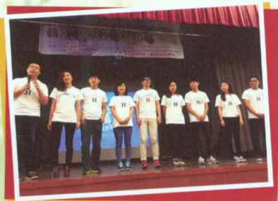
韓東國際大學學生代表

透過是次展覽，學生對韓國升學的途徑、課程、院校設施、收生安排及學習情況有更多認識。為了讓本校學生對韓國升學有進一步的認識及了解，本校升學及擇業輔導組將於本年10月舉辦「韓國升學就業及文化考察團」，希望同學踴躍參與。