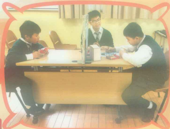
同學在默契遊戲中鍛煉普通話

普通話學會與中文學會協辦名為「默契」的攤位遊戲。同學們在遊戲中和小夥伴更有默契，也能藉此訓練普通話，真是一舉兩得。