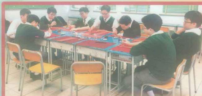
同學在揮春工作坊中揮筆寫福

揮春工作坊在余宏志老師的帶領下，同學齊聚一室，帶著滿滿的祝福，寫下屬於自己的揮春，再帶回家慶賀新年的來臨。