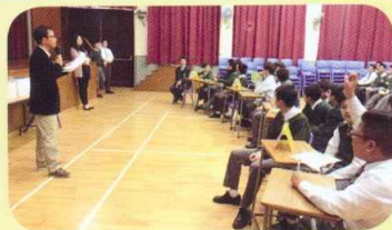
各班代表踴躍答題

中二級文化常識問答比賽在一月三十日午膳時段舉行，由老師及幹事設下擂臺。除了考驗中二同學的文言知識外，比賽特設影片問答環節，同學能從中領悟更多語文歷史知識。