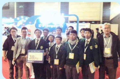
首次試車後，大會為同學記錄速度