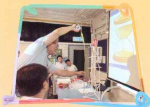
量度飲管塔的高度

本校物理科於二零一八年十月十三日為中二甲班同學舉行了《飲管閣樓》設計比賽。同學需在限時內運用飲管和膠紙搭建一座可承載一罐汽水的飲管塔。是次活動目標在於培養同學於數理科的共通能力，體驗 STEM 精神。本校的科學組將定期為不同班別舉辦更多 STEM 活動，希望同學能學以致用。