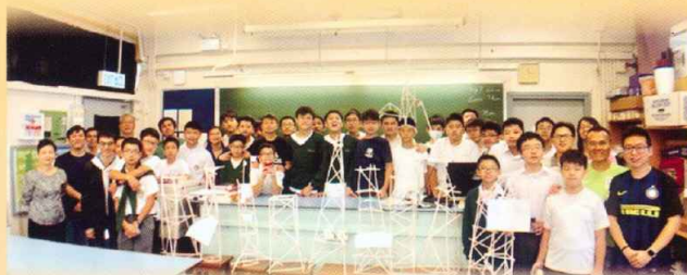
老師及同學與各組作品大合照

本校物理科於二零一八年十月十三日為中二甲班同學舉行了《飲管閣樓》設計比賽。同學需在限時內運用飲管和膠紙搭建一座可承載一罐汽水的飲管塔。是次活動目標在於培養同學於數理科的共通能力，體驗 STEM 精神。本校的科學組將定期為不同班別舉辦更多 STEM 活動，希望同學能學以致用。