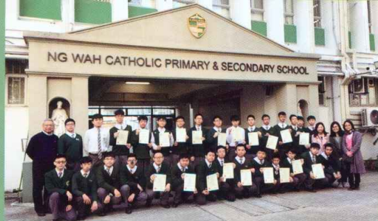
徵文比賽 佳作結集成書