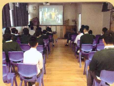
同學們專心欣賞電影 《赤壁·決戰天下》

中文學會為了培養各位同學對中國文化的濃厚情懷，加深對中國歷史的認識，特於二零一九年一月二十八日至三十一日舉辦中文周，透過一連串精彩有趣的活動讓各位同學如臨三國世界，體味三國文化，以嶄新的方式帶動學校的文化氣氛。