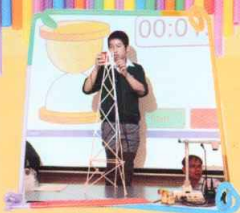
同學嘗試把汽水罐放置於塔頂