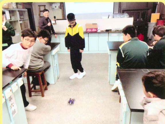
腦電波意念機械蜘蛛