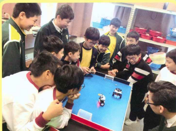
編程機械人足球比賽

「編程機械人」活動中，小六生嘗試探索電腦科中的編程 (coding)，利用「micro:bit」元件、傳感器、藍牙技術等，製作遙控程式機械人，以足球比賽型式決一勝負，寓學習於遊戲中！