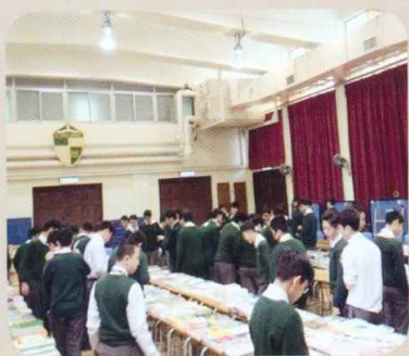
同學們正搜索心儀書籍

三國主題書展「立志讀書洞世情」一月二十八日至一月三十日於本校禮堂舉行，為配合本年度中文周主題「三國」，展內更設有三國好書推介，為一眾同學帶來值得細細拜讀的書籍。禮堂人山人海，同學都對書籍愛不釋手，紛紛搜索心儀書籍。積學儲寶，自我增值。