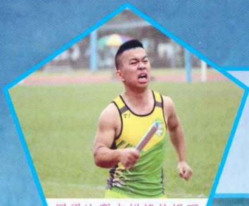
同學比賽中拼搏的場面

十一月十三日及十四日期間，我校於九龍灣運動場舉行第四十三屆運動會。是次運動會取得空前的成功，同學反應熱烈，一共有751人參與，並刷新了不少新紀錄，戰績顯赫，振奮人心。