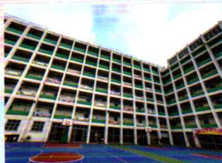
優異：放學後的校園 中六甲 熊浩楠