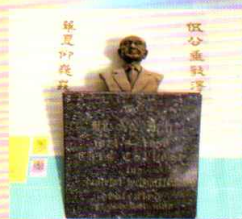
優異：無題 中二丁 黃凱楠