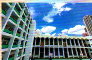
亞軍：校園 中一甲 鄺淳喆