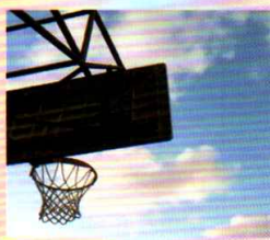
優異：無題 中二丁 蔡駿宇