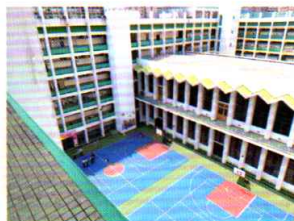
季軍：最後的風景 中六甲 吳炎林