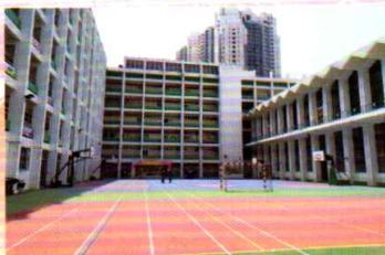
優異：臨別校園 中六甲 黃凱俊