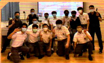
屏幕中的長者以 V 字手勢感謝同學們為他們帶來歡樂