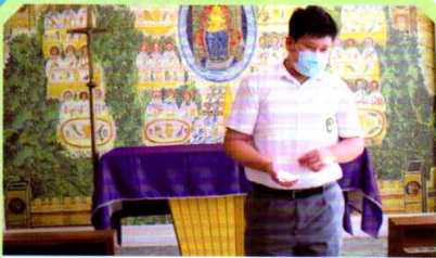
學生介紹自己的製成品

中六同學即將離校參與公開試。他們這幾年的課堂及學習受到疫情嚴重影響。我們特別於宗教周舉行畢業學生祈禱會，為中六同學祈禱及邀請校監周神父降福及勉勵同學，並邀請中六同學填寫對自己將來的展望。