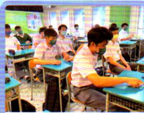
領袖訓練—溝通技巧