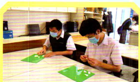
學生正製作代表自己的物件