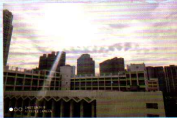
優異：天主撥開雲層 讓伍華受祂的照耀 中六甲 鍾潤權