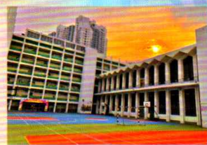
季軍：無題 中一乙 鄭卓熙