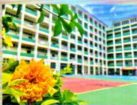
冠軍：太陽花後的校舍 中一甲 賈諾