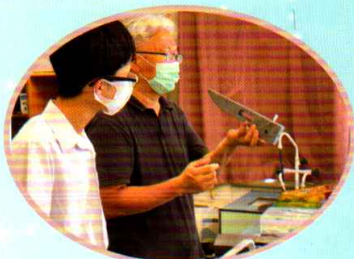
老師指導同學製作火箭車

本校物理科及綜合科學科於今年繼續參與 Race to the line 火箭車比賽，是次比賽共有三組，共 9 位中二及中三同學參與。參賽同學於四月份開始學習火箭車的理論及製作，嘗試運用各科知識設計火箭車。本年度的比賽將於 2021 年 7 月 4 日舉行。