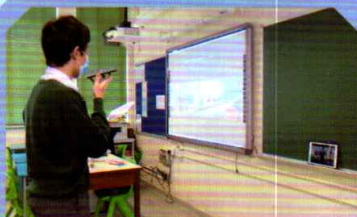
同學以 zoom 形式與長者交談及玩遊戲