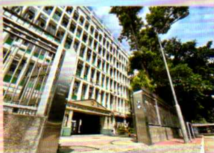
優異：藍天下的活潑伍華 中一甲 雷耀翔