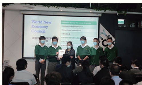
「智慧學校無限想像提案」 專題研習比賽